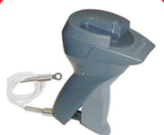
جدا کننده مکانیکی