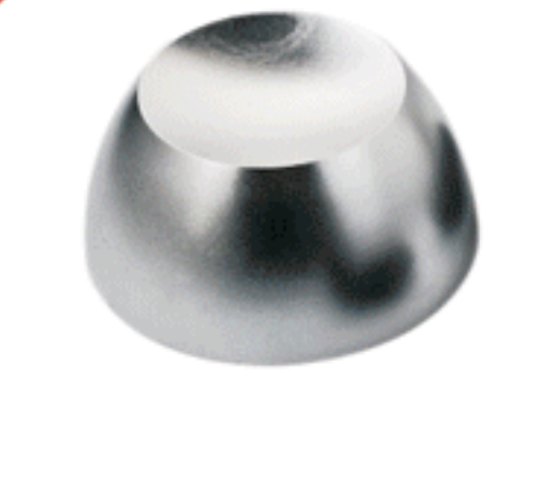
جدا کننده مغناطیسی